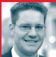
Torsten Panzer ad publica Public Relations GmbH