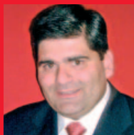
Konstantin Bissias Sea Cloud Cruises GmbH